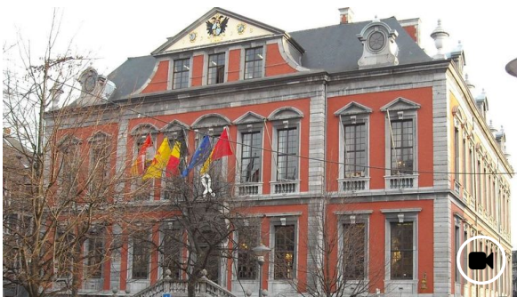
⌚ 08h39 Le conseil communal de Liège retransmis pour la première fois en direct sur internet