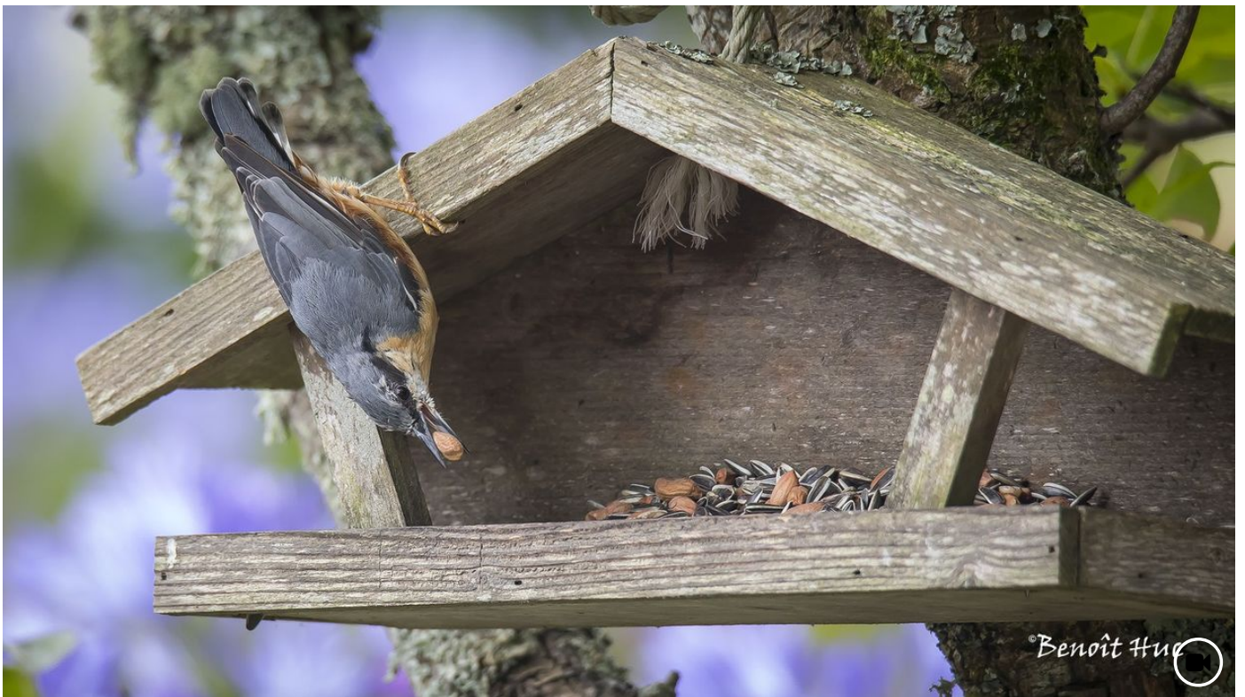
⌚ il y a 29 minutes Dis-moi quelles mangeoires tu places dans ton jardin et je te dirai qui vient manger chez toi