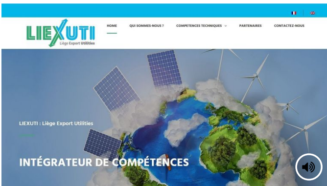
⌚ 08h22 Liexuti, c'est fini