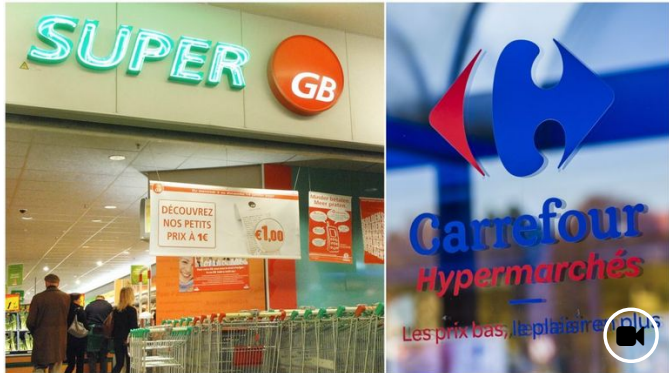
⌚ 25 janvier 2018 Comment GB est devenu Carrefour: retour sur la disparition d'un symbole belge (vidéos)