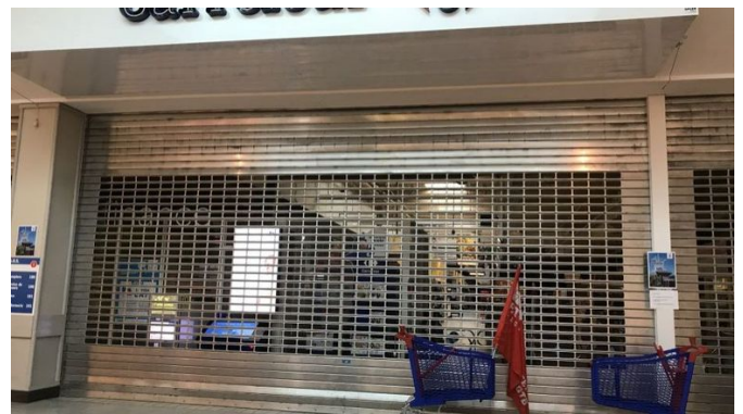
⌚ 08h16 Liège: le magasin Carrefour de Belle-Ile restera volet baissé ce lundi