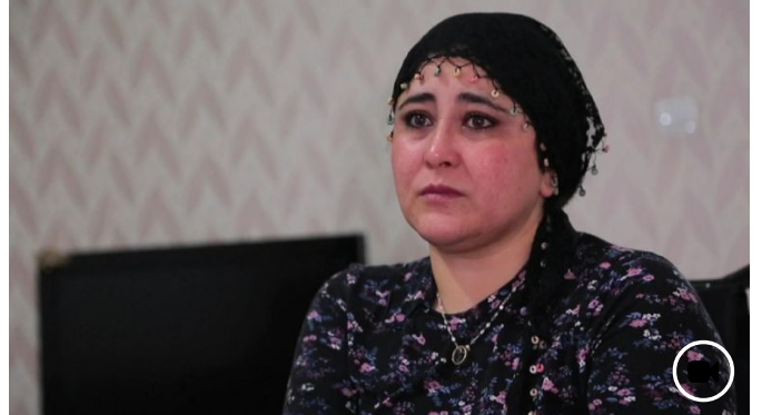
⌚ 24 janvier 2018 En Turquie, mariée de force et victime de violences: "Mon mari m'a tiré 7 balles dans les bras et les jambes"